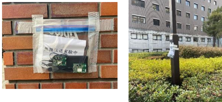
図3 無線機の設置例